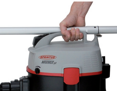
Maximale Ergonomie: Der Sauger kann inklusive Zubehör bequem mit einer Hand getragen werden.