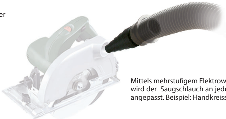
Mittels mehrstufigem Elektrowerkzeugadapter wird der Saugschlauch an jeden Durchmesser angepasst. Beispiel: Handkreissäge.