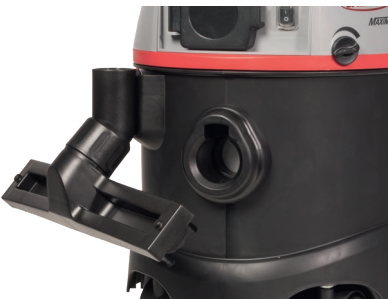
Sauggeschirr Parkposition seitlich am Gerät.