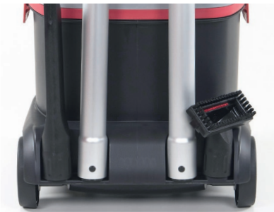
4 Zubehörsteckplätze auf der Rückseite.