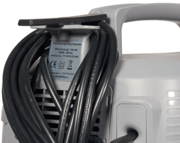
Verschließbarer, geräumiger Kabelhaken.