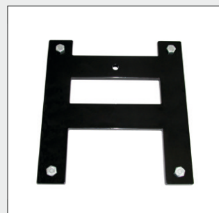
Ersatzradhalterung zum Anbau des TendoMat® am Geländewagen.