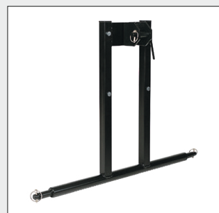
Dreipunktbock KAT 0, KAT I, KAT II zum Anbau an die Ober- und Unterlenker der Hydraulik.

Perfekt Clean ihr Partner rund ums reinigen Reinigungsbedarf