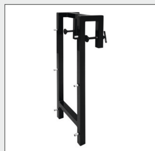
Bordwand-Halterung zum Einhängen an eine gerade Bordwand.